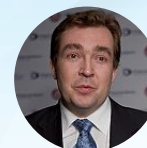
АЧКАСОВ Евгений Евгеньевич

Президент Ассоциации частных многопрофильных клиник, член президиума «ОПОРЫ РОССИИ»